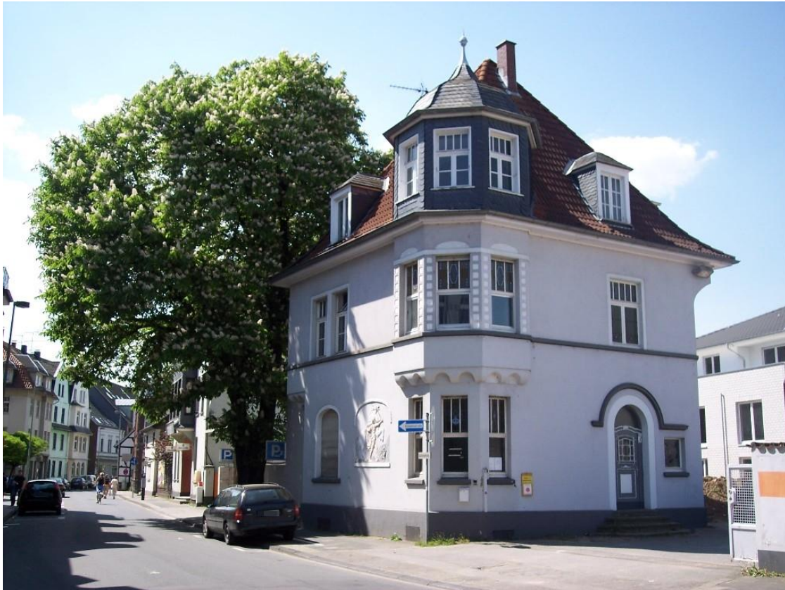
Frontansicht Büroeinheit Altstadtstraße 36